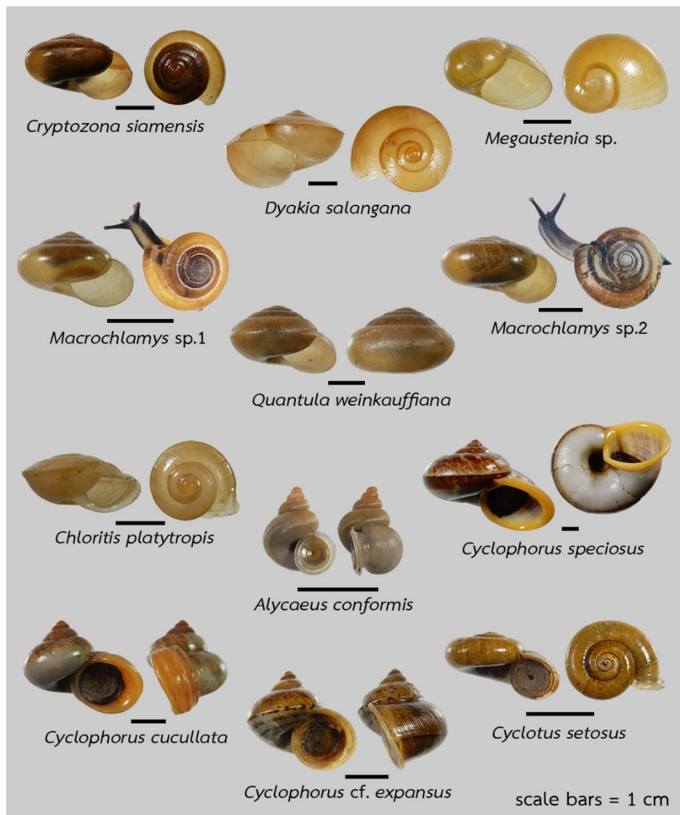
ภาพที่ 2 หอยทากบกที่พบบนเกาะภูเก็ตและเกาะใกล้เคียง

พื้นที่เก็บตัวอย่างที่พบจำนวนชนิดของหอยทากมากที่สุด คือ บริเวณน้ำตกบางแป และน้ำตกโดนไพร พบ 13 ชนิดเท่ากัน รองลงมา คือ เกาะโหลน พบ 9 ชนิด และน้ำตกโดนอ่าวย่น เกาะราชาใหญ่ และเกาะตะเก่าน้อย พบ 8 ชนิด