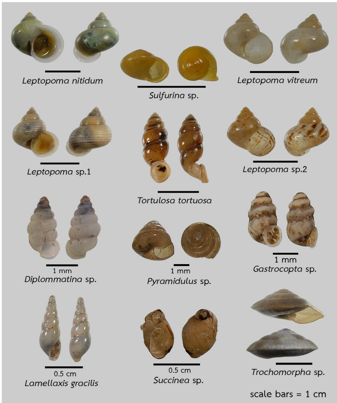
ภาพที่ 2 (ต่อ) หอยทากบกที่พบบนเกาะภูเก็ตและเกาะใกล้เคียง